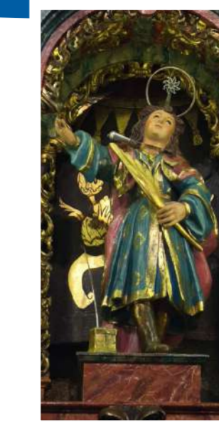
San Ginés de Arlés

Esta iglesia fue construida a principios del s. XVI (1514) y en este mismo siglo se vio afectada por un incendio a causa de la incursión del pirata Francis Drake en la ría de Pontevedra. La importancia que tuvo Sanxenxo como capital de la jurisdicción de A Lanzada, que era parte de la provincia de Santiago cuando Galicia tenía 7 provincias allá por el siglo XVIII, justifica las continuas modificaciones de este templo, costeadas por benedictinos, cistercienses y la familia Saavedra Miraflores.